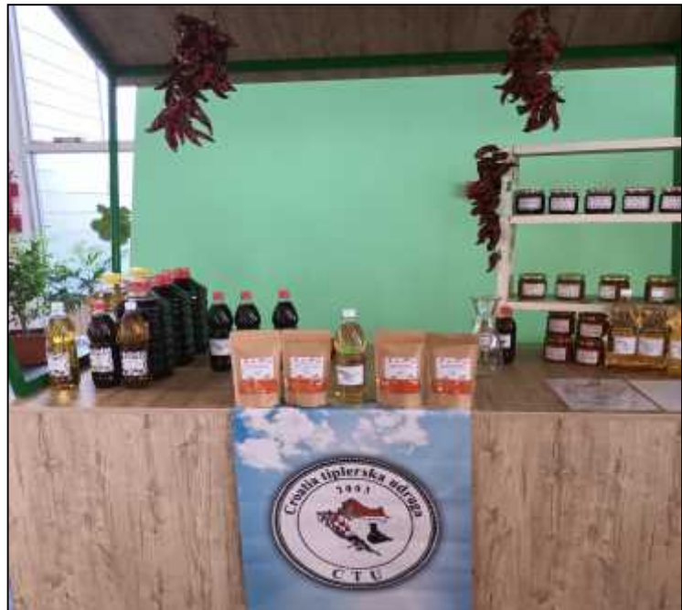
Sve estitke organizatoru, opuštenu i ugodnu atmosferu i bogatu trpezu