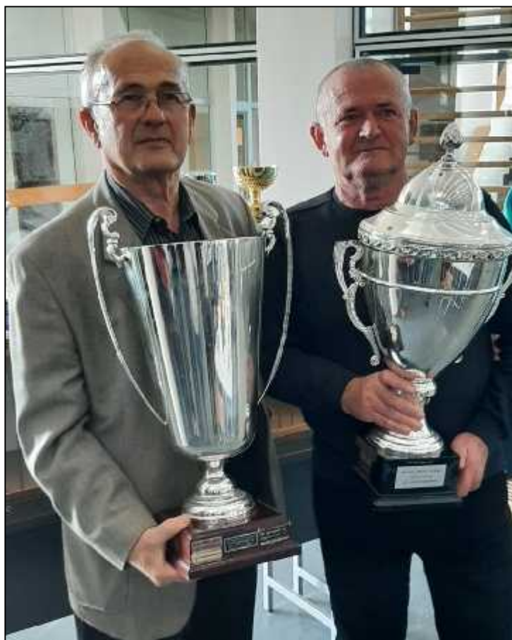
Dodjela prelaznih pehara za Let Grda Vukovara