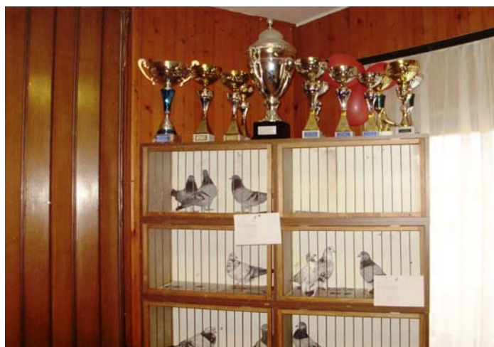
Pobjednička jata i nagrade