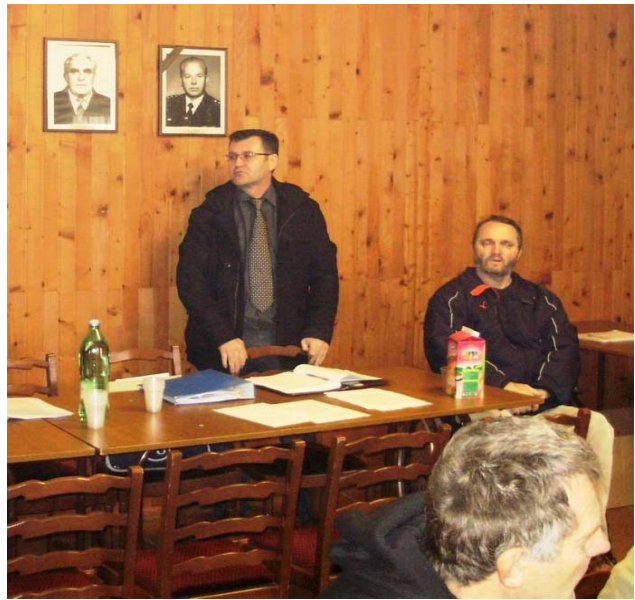
Izvešće predsjednika CTU