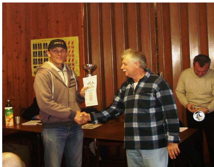
B. Šibenik , 2. mjesto juniori