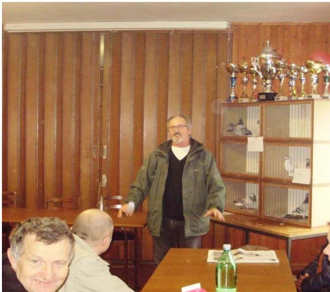
Predstavnik organizatora pozdravlja skupštinu