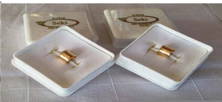
Zlatno prstenje za najduži seniorski i juniorski let u natjecateljskoj sezoni