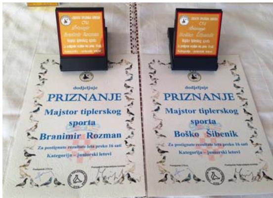
Priznanja majstorima tiplerskog sporta