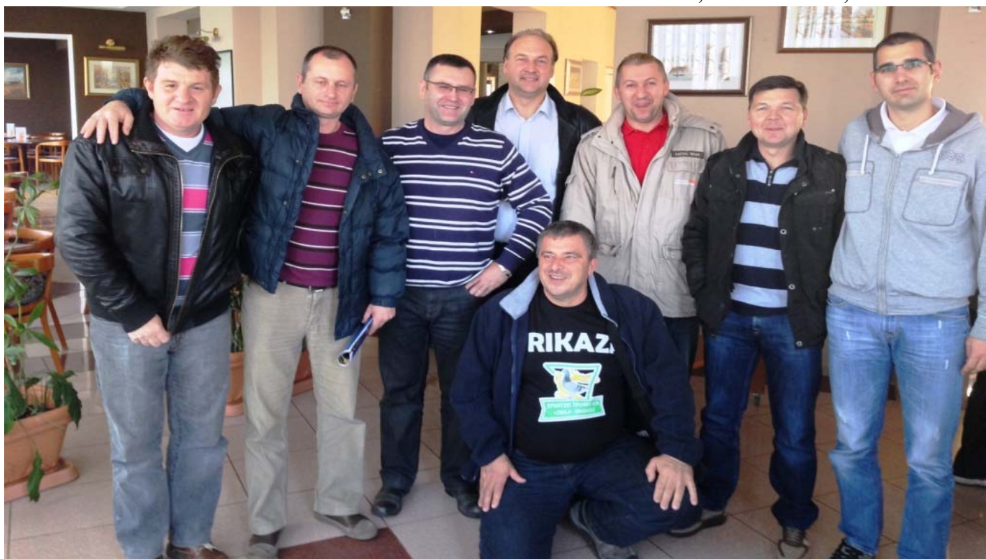
Gosti CTU Skupštine iz BHTU i STSV